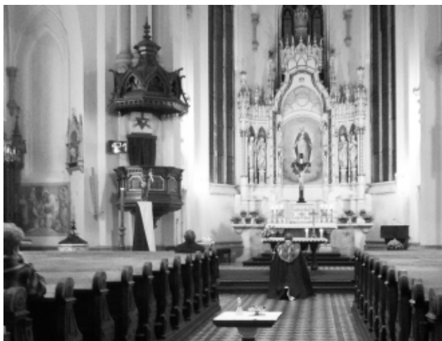
Modlitba růžence za zemřelé 2.11. od 16:30

Modlitba za zemřelé patří mezi druhy přímluvné modlitby. Při každé mši se na ně minimálně dvakrát vzpomíná, při přímluvách a v eucharistické modlitbě. Dále pak v denní modlitbě církve. Také celý první listopadový týden je zacílen na pomoc zemřelým formou získávání odpustků.