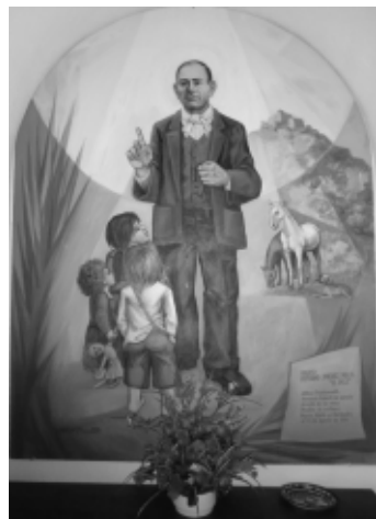
Obraz z kostela v Barbastru, Španělsko