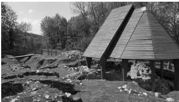
Klastrompuszta Pálos emlékhely Ruiny prvního kláštera Paulínů

Během archeologických prací v roce 2013 byly v ruinách kláštera nalezeny cihly, které maďarští Paulíni darovali všem paulínským klášterům po celém světě.