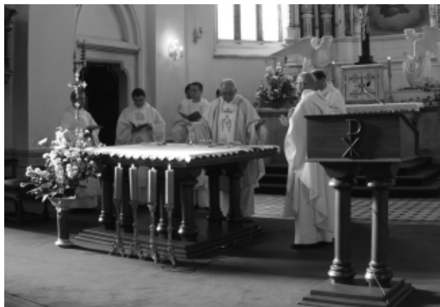
Mše sv. 15.8.2014