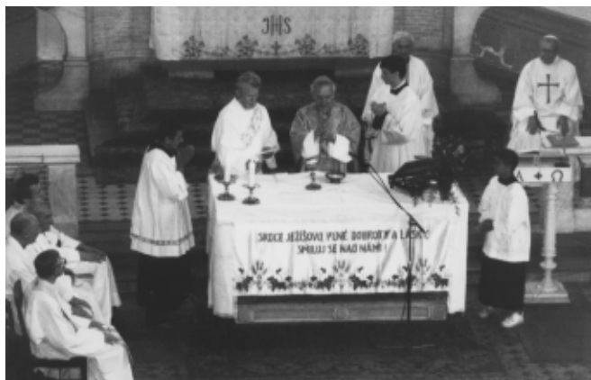
Mše sv. 31.8.1994, uvedení Paulín