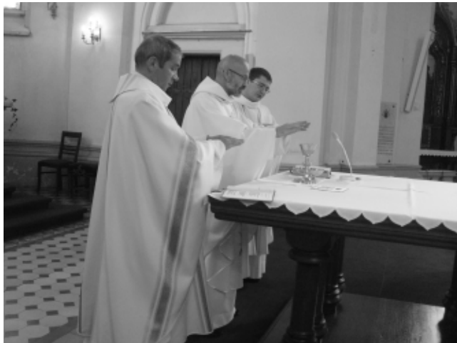
Mši sv. 15.8. v 8:00 sloužili p řívozští otcové

V tomto čísle Přívozníku přinášíme již avizované ohlédnutí za historií vzniku a působení Řádu Paulínů v Ostravě-Přívoze. 20. výročí působení řádu jsme si připomněli o slavnosti Nanebevzetí Panny Marie 15.8.2014.