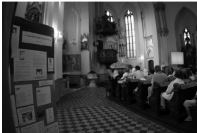
Mše sv. 15.8.2014, vlevo „výro ní“ nást nka

I přes vsřícnost jsem nechápal proč zrovna my. Teprve po několika měsících našeho pobytu v Ostravě v kostele na zdi jsem postřehl dříve mnou nepovšimnutou kopii Jasnohorského obrazu Panny Marie. Pomyslel jsem si: to bylo její pozvání. Na tomto území jasnohorská Madona byla a je uctívána.