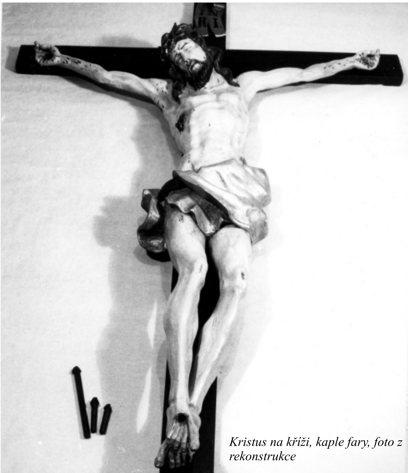
Kristus na kříži, kaple fary, foto z rekonstrukce

Takto důležité znamení přirozeně nesmí být prováděno bezmyšlenkovitě a povrchně, jak to někdy můžeme vidět. To pak působí spíše komicky než bohabojně. Zkuste se někdy na začátku své modlitby pokřížovat takto: pomalu, od čela k hrudi, od levého ramena k pravému, tak, aby vás to celé „zahalilo“. Můžete pak zakusit, jak se díky takovému pokřížování může člověk soustředit.