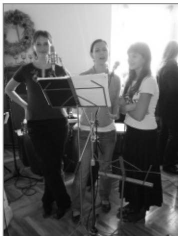
Z výpravy za Poláky

Druhý den v neděli jsme vyrazili do Polska s vírou, že se to podaří. Přijeli jsme do 90km vzdáleného Mochova, kde se klášter nacházel. Zastavili jsme před zídou kláštera. Byl moc krásný, ale tam se nic nechystalo... Můj zrak se obrátil na realitu: budeme hrát v přilehlém vesnickém objektu z 50tých let, kde se v prvním patře podařilo zrekonstruovat dva propojené menší sály. Jeden byl na sezení a ten menší na tanec a hraní. Můj zkraslený sen o neo-barokním sále se rozplynul. Jsem prostě snilek. Během odpoledne a večera jsme si však dobře zahráli a po čase se našlo i několik odvážlivců, kteří si přišli zatančit. Během večera nás poprosil jeden pán, jestli by mohl pustit svého kamaráda zahrát pár písní na naše klávesy. Při naší přestávce jsme jim to umožnili. Po chvíli polský hudebník nastartoval