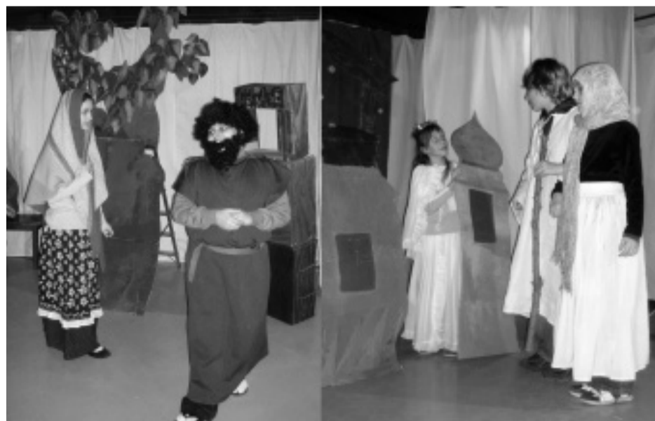
Celník Zacheus / Josef s Marií - pantomima