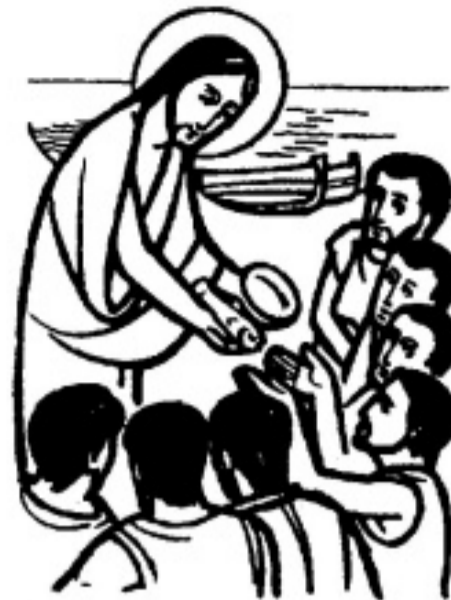
Ilustrační kresba: archiv

Tu akci s vysláním sedmdesáti znáte, že? „Potom určil Pán ještě sedmdesát jiných a poslal je před sebou po dvou do každého města i místa, kam měl sám jít.“ (Lk 10,1) Tito vyslanci dostali jasné pokyny, jak hlásat a jak se chovat k lidem, když je přijmou, i když je nepřijmou. „Posílám vás jako ovce mezi vlky.“ (Lk 10, 3) Všude měli hlásat: „Přiblížilo se království Boží.“ (Lk 10, 11) Dnešními vyslanci Ježíše Krista jsme my. My dnes máme hlásat radostnou zvěst lidem. Od jiných a nikde jinde se ji totiž nedozví. My křesťané máme ten pravý poklad. Nemusíme dnes s tímto