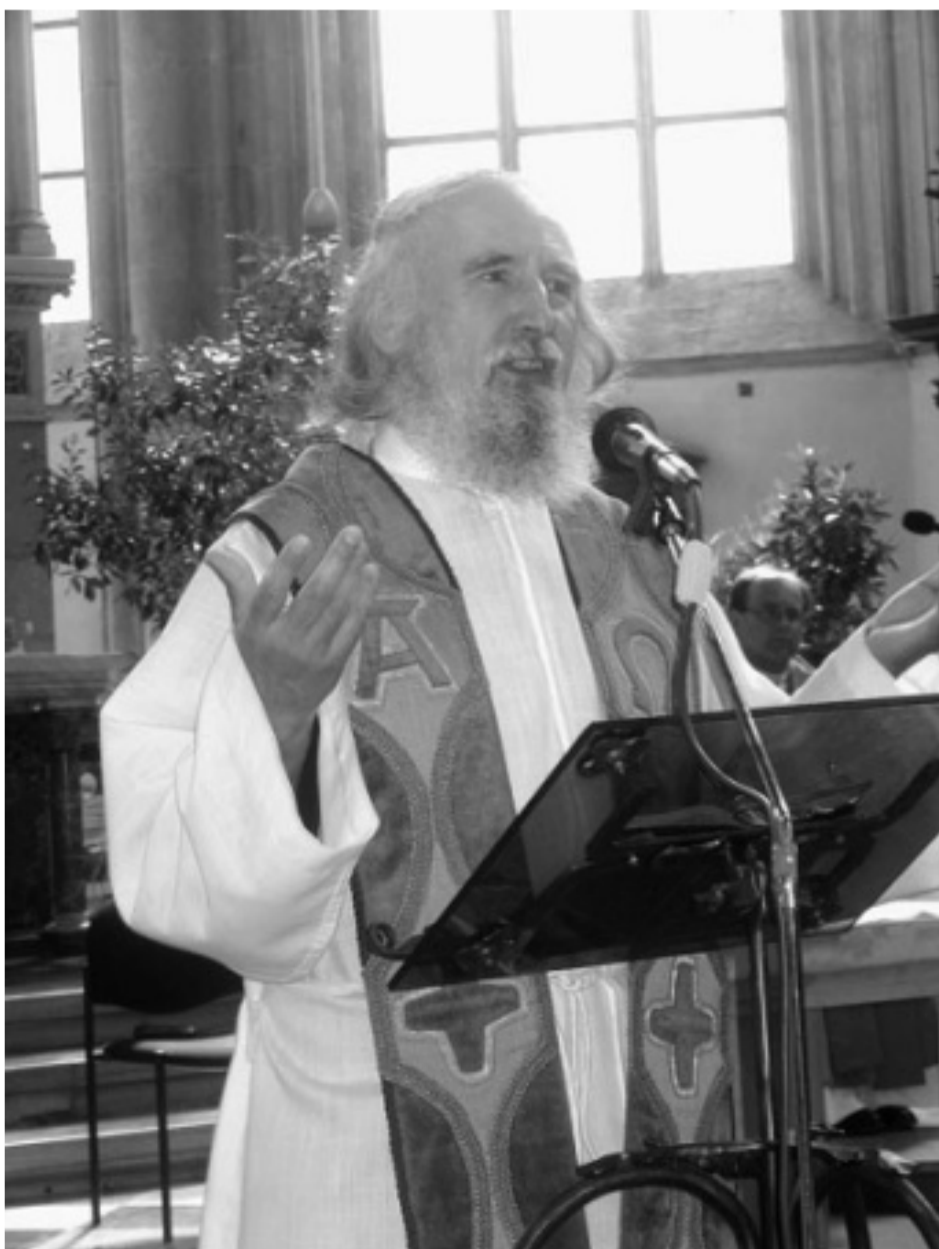
Z třídní návštěvy ČR v červnu roku 2004

Mezi další knihy Josefa Ratzingera patří například: Kompendium katechismu katolické církve, Evropa, její základy dnes a zítra.