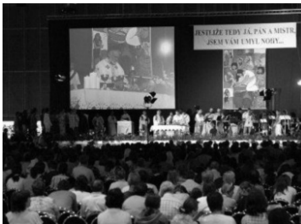
Stejně jako před rokem i letos bude Konferenci hostit prostorný areál Výstaviště Brno

Pokud ještě nejste přihlášení, můžete tak přes internet učinit do 4.7.2008 do 12:00.