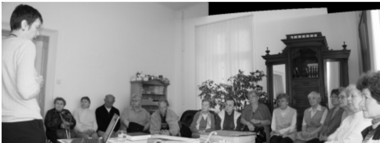
Mary ve společenství seniorů