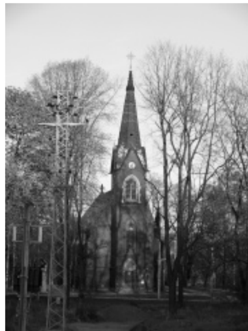
Kostel v Hrušově