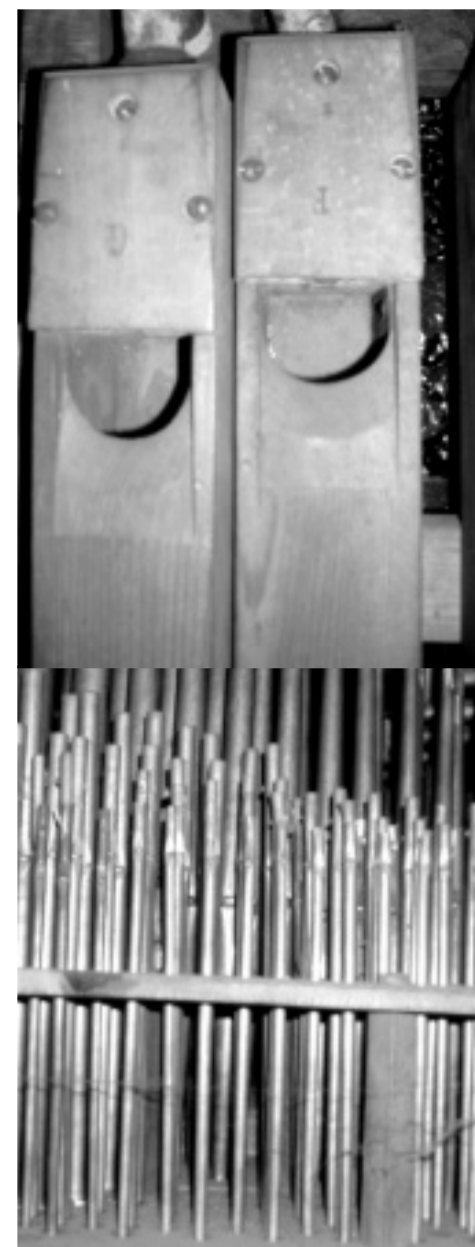
Interiér varhan - píšťaly hanním ventilátorem.

Varhany byly dále několikrát opravovány. K jejich poškozování dochází také vlivem prašnosti a to i uvnitř, protože je znečištěný vzduch nasáván var-