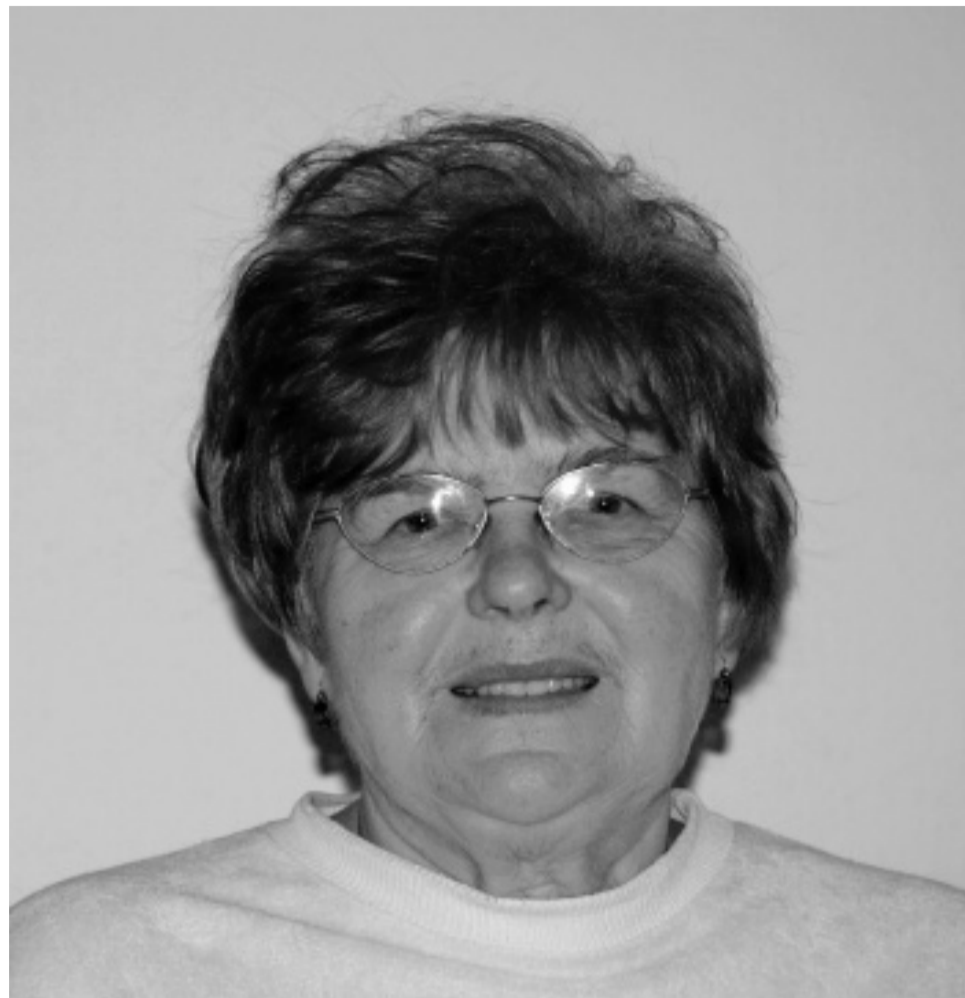
Opírám se o Boha...