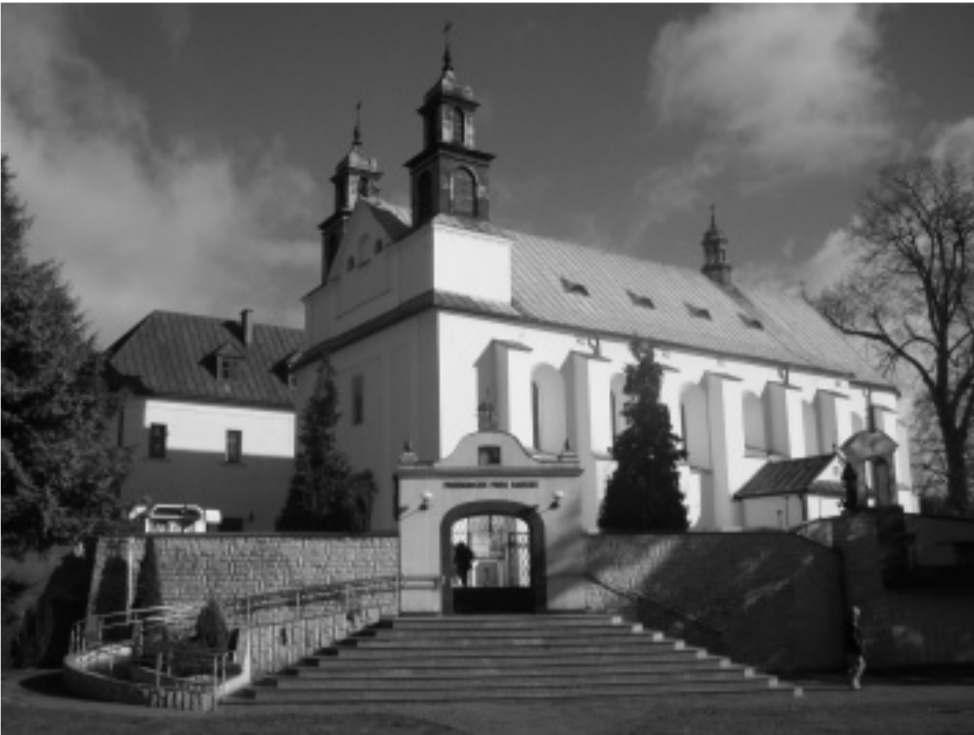
Leśniów, Foto: Jan Košárek

Jako každý rok, i letos jsme vyjeli na pouť, tentokrát do Polska, a to na dvě místa: nejdříve do Leśniowa a poté na Jasnou Horu v Čenstochové.