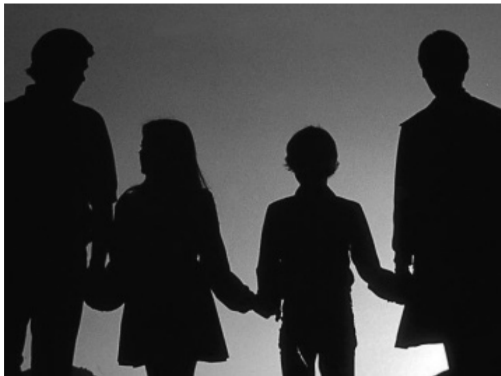
Ilustrační kresba: archiv

- Třicetiosmiletý muž ubodal svého mladého zaměstnavatele, jinak manžela své milenky, protože si chtěl uspokojit své ambice v řízení firmy a jako bonus získat i