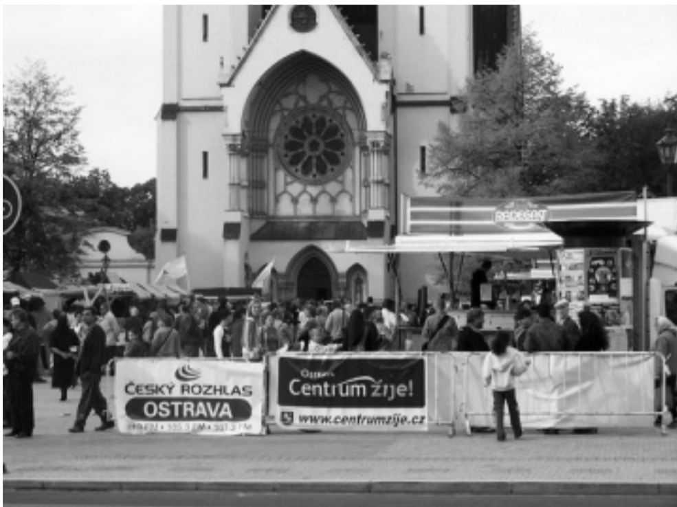
Ilustrační foto ze Svatováclavského jarmarku

Hovořit o náboženském vědomí v České republice je docela obtížné již proto, že obecně lze českou společnost označit za ateistickou. Kdybychom se dotázali většího počtu našich obyvatel na to, co jim říká mnohem jednodušší pojem „církve“, tak jejich odpovědi by byly s velkou pravděpodobností dostatečně zmatené a pojem by vůbec nevystihovaly a to i přesto, že naše země patří z historického pohledu k zemím, jejíž vývoj byl nezbytně závislý na církvi.